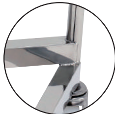
補強接続部は全周溶接仕上