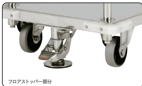
フロアストッパー部分